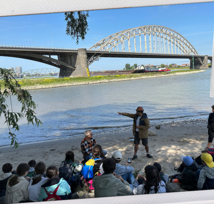
Journée avec les élèves du Lycée français Van Gogh La Haye-Amsterdam à Nimègue