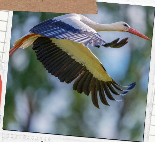
Cigogne blanche (Ciconia ciconia)