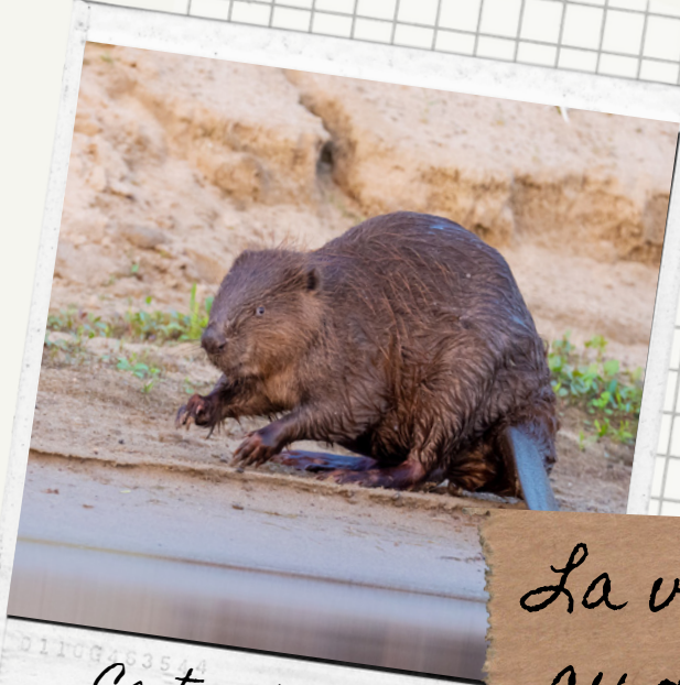
Castor d'Europe) (Castor fiber)