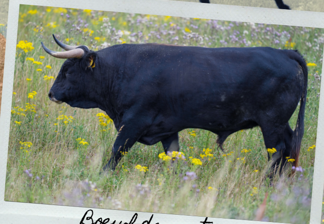
Bœuf domestique ( Bos taurus )