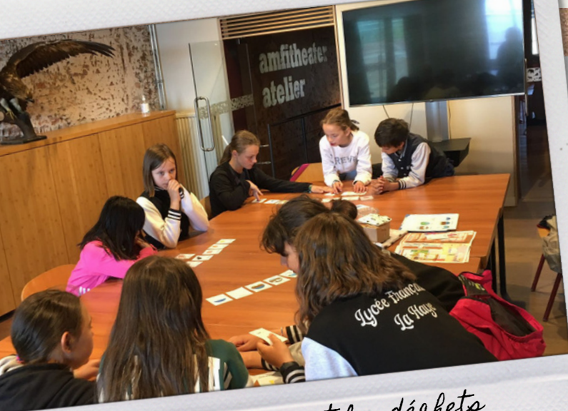
Atelier sur l'eau et les déchets au musée De Bastei (Nimègue)